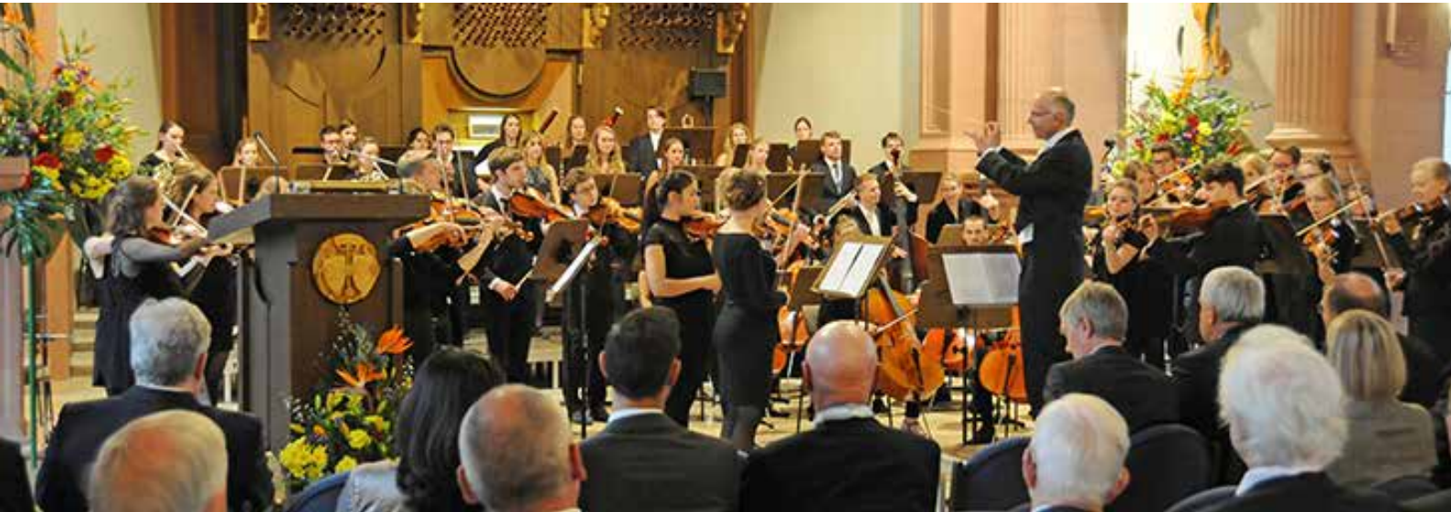
Das Akademische Orchester spielte zum Stiftungsfest auf.