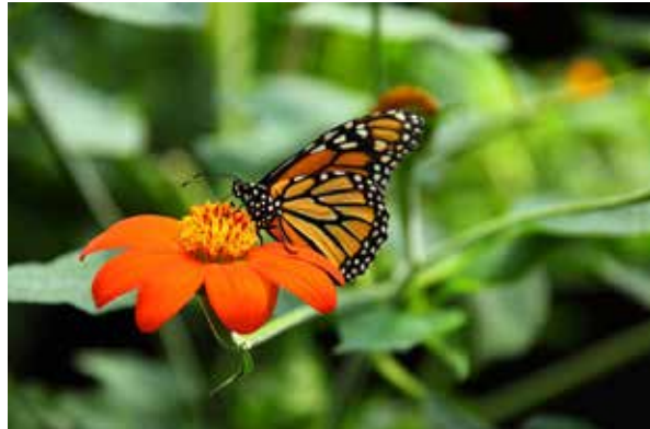
Ein Monarchfalter saugt Nektar aus einer Blüte.