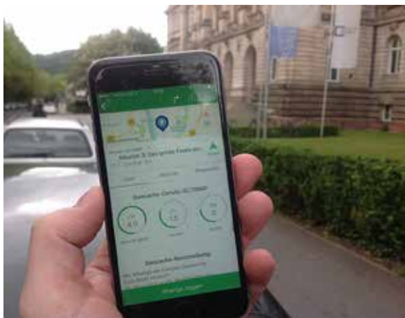
Mit einer Rätselroute den Campus und die wichtigen Eckdaten der Universität spielerisch entdecken: Das ist seit Mitte April möglich und wird intensiv genutzt.

„Später haben wir uns aufgrund der guten Implementierung dazu entschlossen, das Spiel als Geocache zu veröffentlichen, da dort eine fertige Plattform und eine Community zur Nutzung existiert“, erklärt Janiesch. Beim Geocaching werden in freiem Gelände versteckte Behälter mithilfe von GPS-Geräten, heute oft Smartphones, gesucht, geloggt und anschließend am selben Ort wieder versteckt.