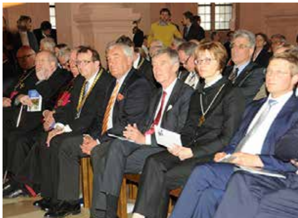
Stiftungsfest 2017 der Universität Würzburg: Blick in die Reihen der Gäste.

Wir können in diesem Jahr ein für unsere Universität bedeutendes Jubiläum begehen: Vor 400 Jahren, im Jahr 1617, verstarb Fürstbischof Julius Echter, der Mann, dem wir die Wiedergründung unserer Universität verdanken. Aus diesem Anlass würdigen wir sein Leben und Wirken mit einer Sonderausstellung ab dem 25. Juni in dem dann nach seiner derzeitigen Renovierung neu eröffneten und neu gestalteten Martin von Wagner Museums unserer Universität. Die Ausstellung unter dem Titel „Julius Echter. Patron der Künste“ wird viele bisher weitgehend unbekannte Facetten des Fürstbischofs aufzeigen, und ich möchte Sie schon jetzt alle herzlich einladen, sie zu besuchen.