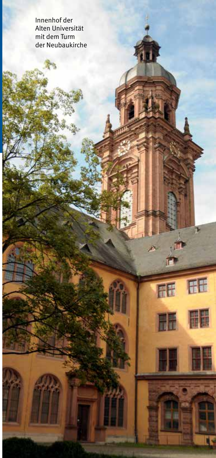
Innenhof der Alten Universität mit dem Turm der Neubaukirche