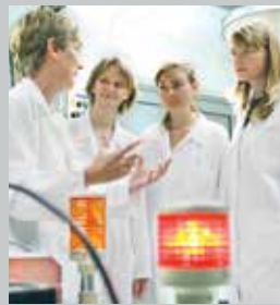
Ausbildung im Forschungslabor

Alte Welt, Anglistik/Amerikanistik, Biologie, Biochemie, Biomedizin, Chemie, Computational Mathematics, Cultural Landscapes, Digital Humanities, Europäische Ethnologie/Volkskunde, Evangelische Theologie, Funktionswerkstoffe, Games Engineering, Geographie, Germanistik, Geschichte, Indologie/Südasienkunde, Informatik, Katholische Theologie, Kunstgeschichte, Kunstpädagogik, Lebensmittelchemie, Life Sciences, Luft- und Raumfahrtinformatik, Mathematik, Mathematische Physik, Medienkommunikation, Mensch-Computer-Systeme, Modern China/Chinese Studies, Museologie, Musikpädagogik, Musikwissenschaft, Nanostrukturtechnik, Öffentliches Recht, Pädagogik, Philosophie, Philosophie & Religion, Physik, Political and Social Studies, Privatrecht, Psychologie, Romani-