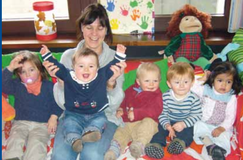
Centro per i più piccoli presso il Campus Am Hubland