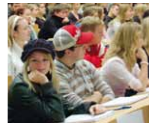
Lezione nell'Audimax dell'Università

Studenti davanti all'Edificio di aule e sale seminariali nel Campus di Hubland