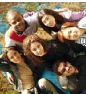
Würzburg accoglie studenti da tutto il mondo

L'Università assicura le nuove scoperte e i risultati della ricerca e garantisce delle licenze, oltre a supportare i propri scienziati nella fondazione di nuove compagnie.