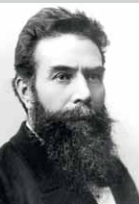
Il fisico Wilhelm Conrad Röntgen, che nel 1895 scoprì a Würzburg i Raggi X.

Fondata nel 1402, la Julius Maximilians Universität di Würzburg è una delle prime università tedesche per la sua ricca tradizione di ricerca. Qui, nel corso dei secoli, hanno lasciato il segno molti scienziati di fama mondiale, come Rudolf Virchow, Carl Siebold e Franz Brentano.