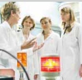
Professoressa e studentesse nel laboratorio di ricerca

L'Elitenetzwerk bavarese offre anche dei corsi di laurea „elitari“ nelle discipline tecnologia delle nanostrutture e fisica.