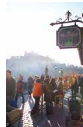
Gente in strada nell'Alte Mainbrücke

E' proprio lungo il Meno, con le sue stradine, i suoi prati e le varie trattorie, che si svolge gran parte della vita degli studenti: Würzburg ti permette, tra le tante cose, di scoprire la musica e la cultura del vicino continente in occasione del più grande Festival Africano d'Europa, e di assistere a concerti e pièces teatrali su un palco galleggiante durante il Dock Festival. Un'altro evento molto amato è il Festival di Mozart, dove possiamo ascoltare la dolce "Serenata in sol maggiore" nell'atmosfera rilassata e romantica dei giardini della Residenza.