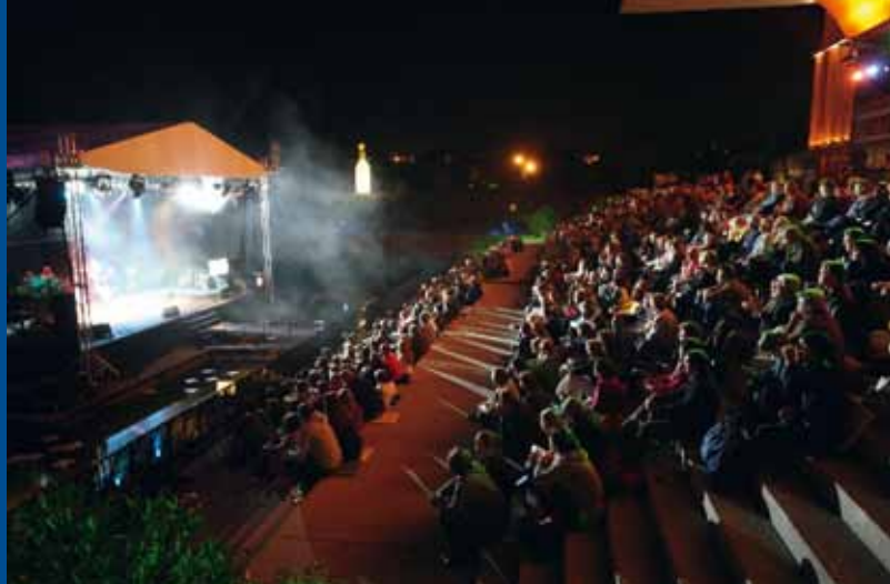
Concerto durante l'Hafensommer

Il centro della città è piccolo e facilmente percorribile a piedi , o in bicicletta per i più sportivi.