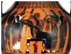
Antico vaso greco nel Museo Martin-von-Wagner