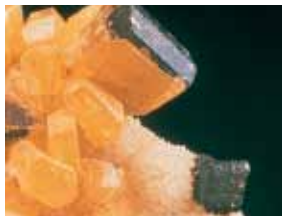
Cristalli di zolfo nel Museo Mineralogico