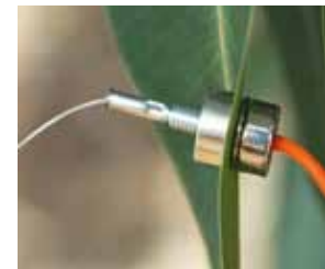
Sonda magnetica che permette di analizzare l'approvvigionamento idrico delle piante: metodo inventato nel centro di biologia