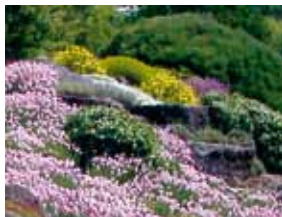
Brughiera mediterranea nel giardino botanico