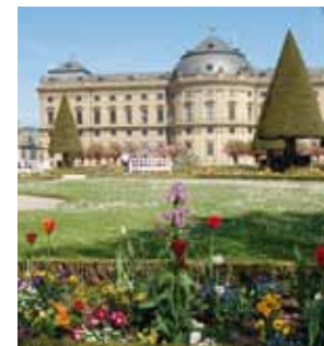
La Residenza, protetta dall'UNESCO

Tutti questi eventi e organizzazioni, assieme alle altre offerte culturali e ricreative – performance teatrali, concerti, festival all'aperto e festival del vino- fanno di Würzburg una città eccezionale sia per vivere che per lavorare.