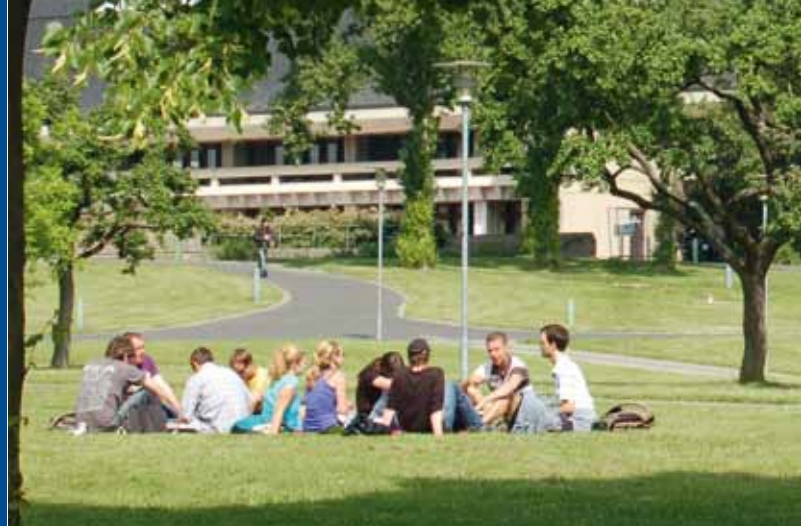
Il Campus di Hubland in estate